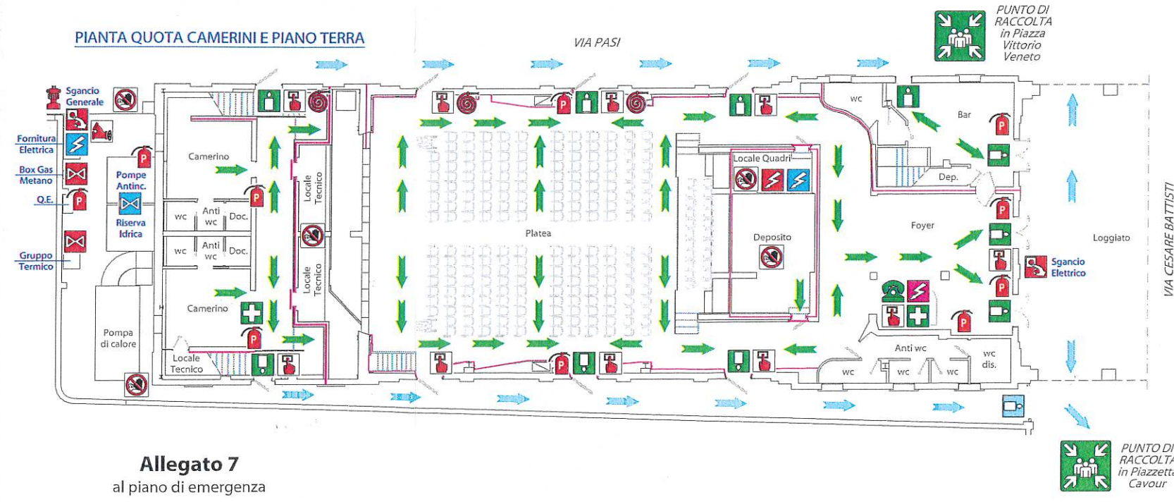
Allegato 7 al piano di emergenza

Rev. IG del 24/05/2014 Nuova file: REV-Teatro Cotogni-Cv.telaio.via.dwg