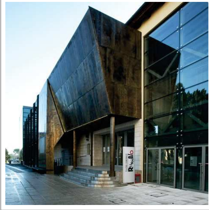
INGRESSO TEATRO PIAZZETTA MARCONI