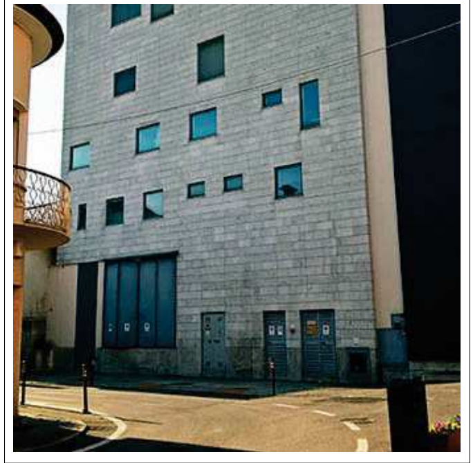
PORTELLONE DI CARICO/SCARICO E PARCHEGGIO INCROCIO TRA VIA S. PELLICO E VIA DEGLI SPALTI