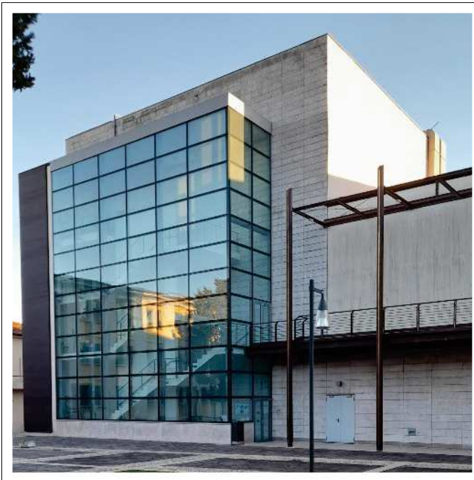
INGRESSO ARTISTI PIAZZETTA MARCONI